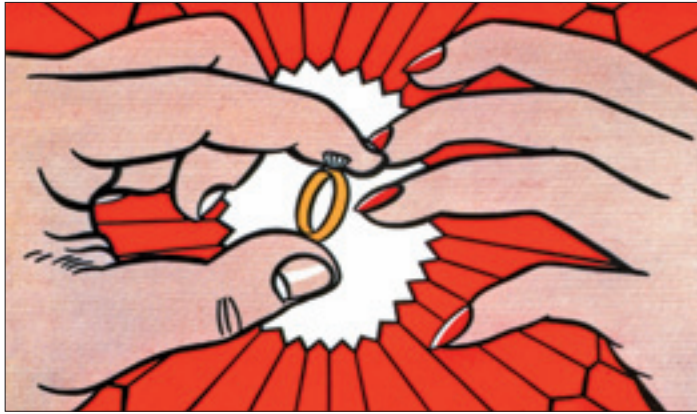
Roy Lichtenstein, «The Ring» (1962)