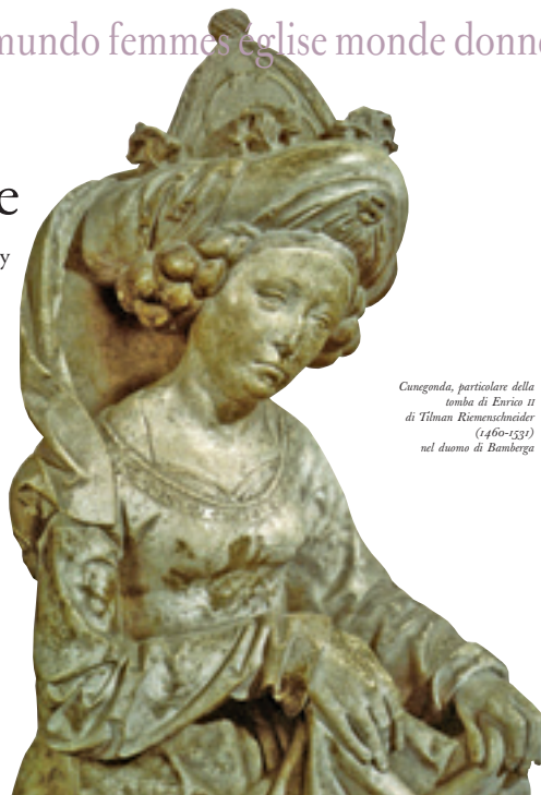
Cunegonda, particolare della tomba di Enrico II di Tilmann Riemenschneider (1460-1531) nel duomo di Bamberg