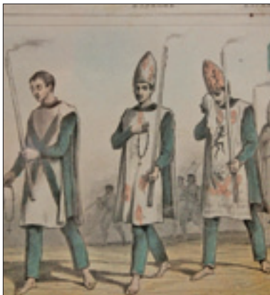
«Conversos» con lo scapolare indossato dai penitenti in una stampa cinquecentesca